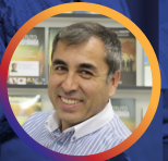
Pr Rodrigo Tapia (Chile-Brasil)